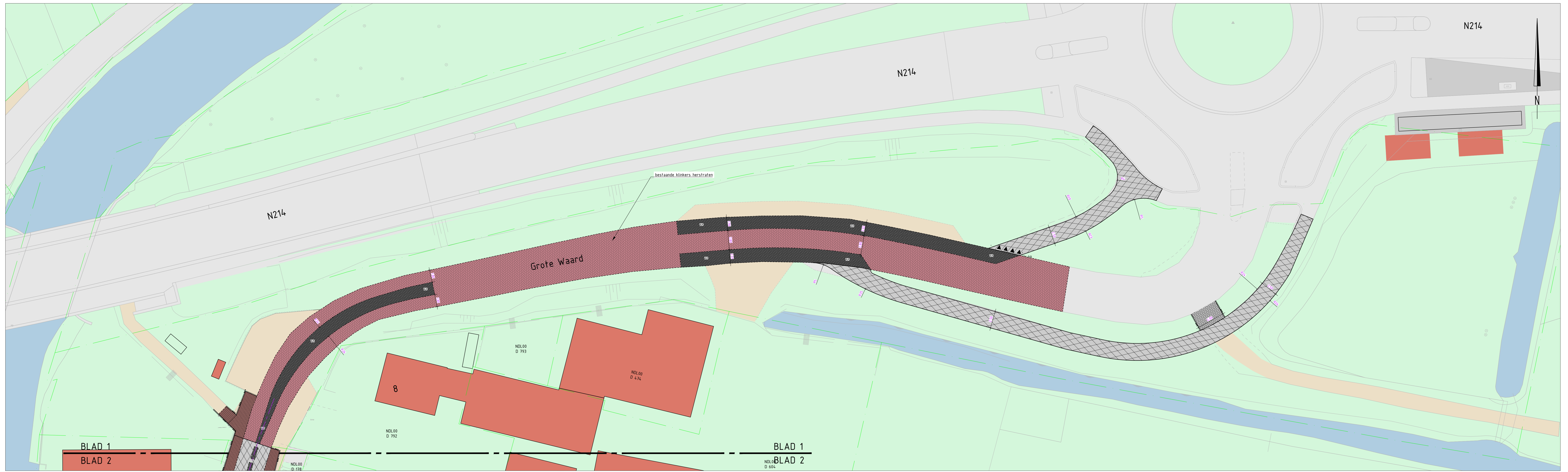
Blad 1 SCHAAL 1: 200