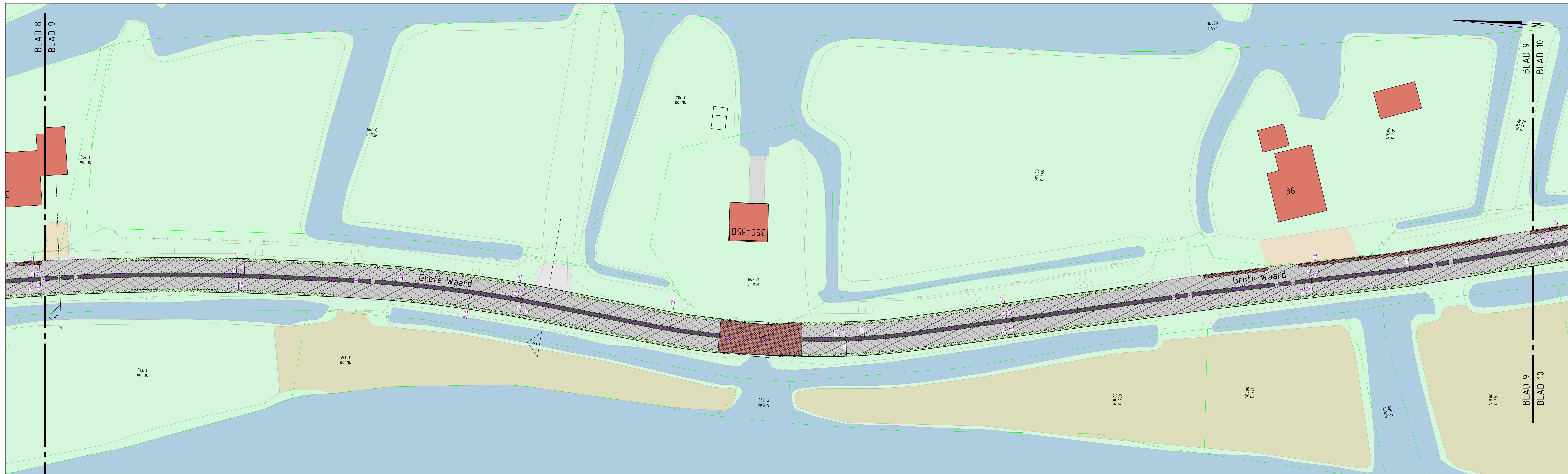
Blad 9 SCHAAAL 1: 200