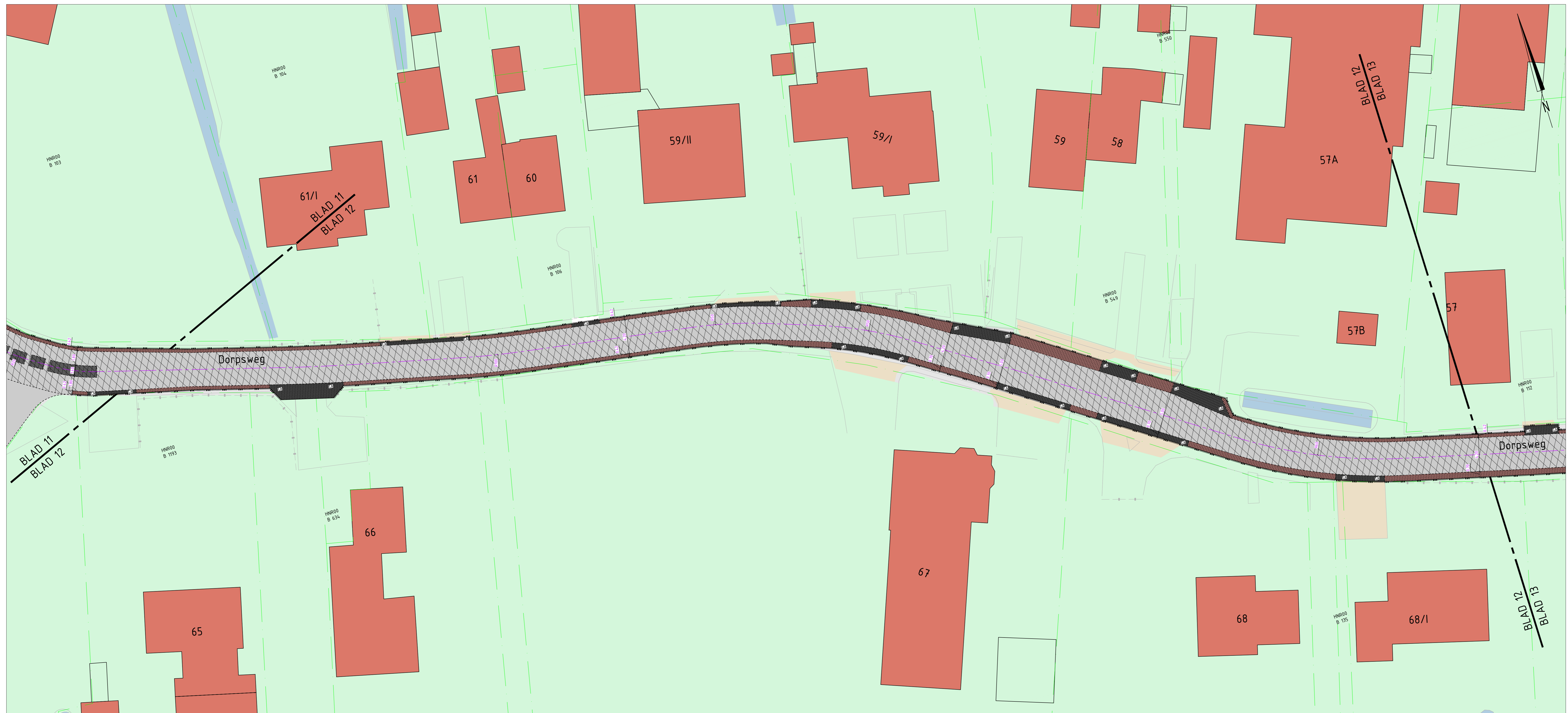
Blad 12 SCHAAL 1:200