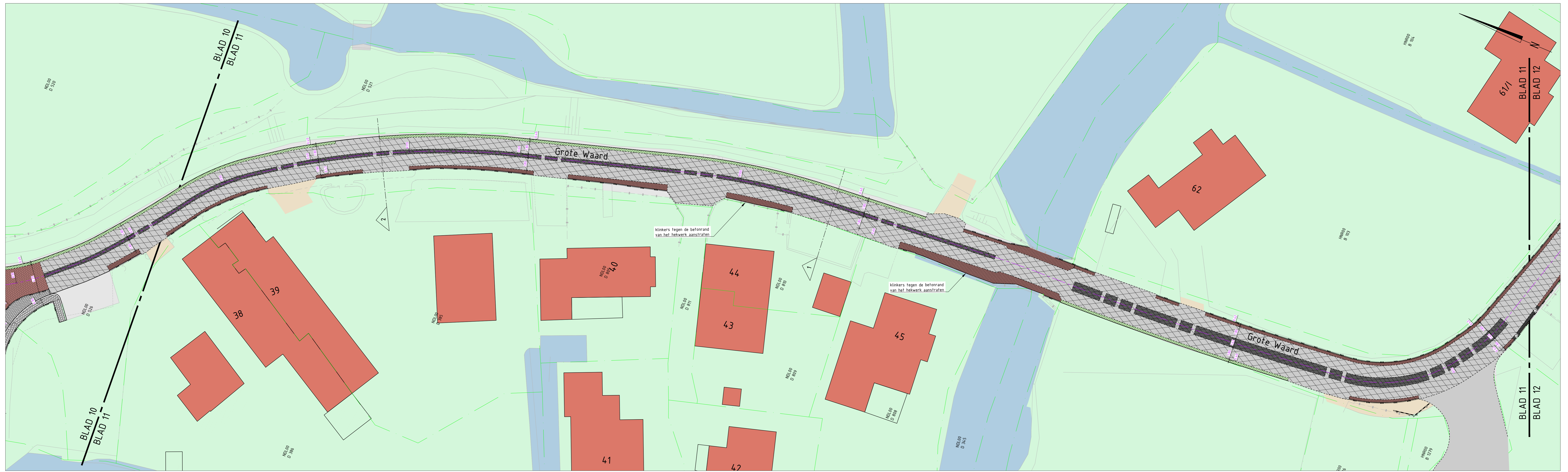
Blad 11 SCHAAL 1:200